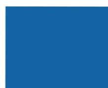
585/000 Blau 205, 218 cm