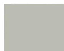
705/000 Hellgrau 205, 218 cm