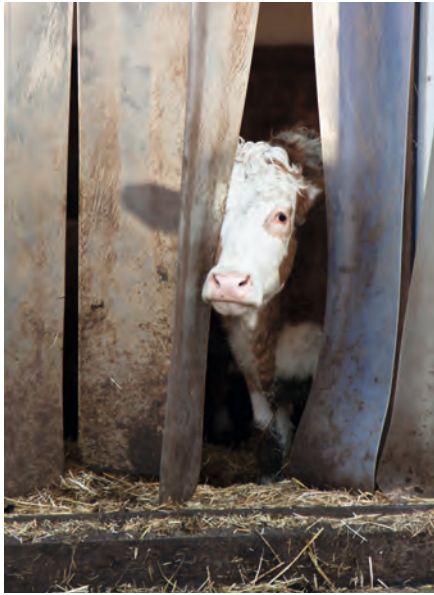
Anwendungsbeispiel für Pendeltüren Application example for curtain systems