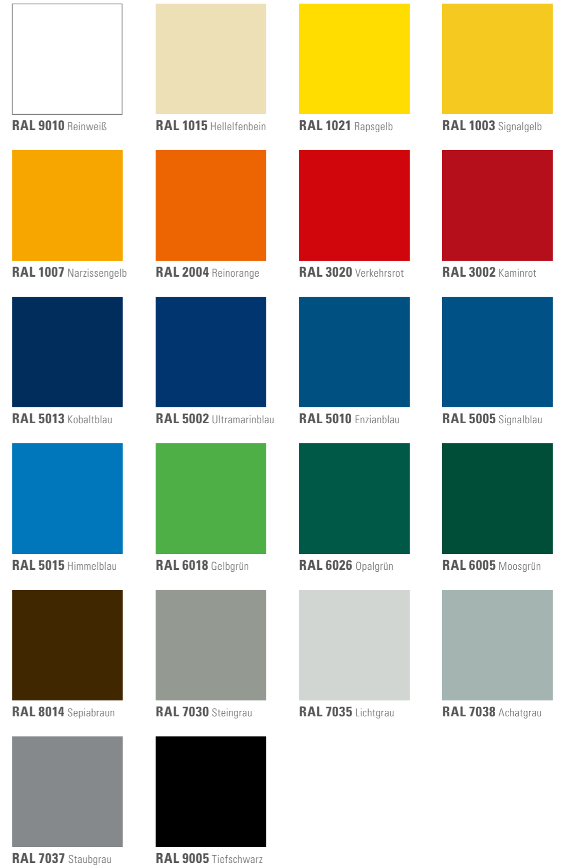
RAL 9010 Reinweiß