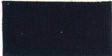
RS - 174 captain navy blue