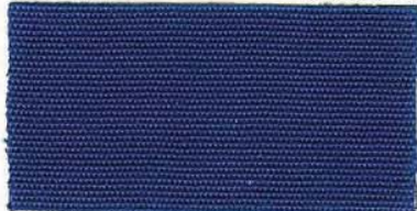
RS - 172 pacific blue