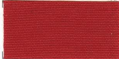
RS - 176 red