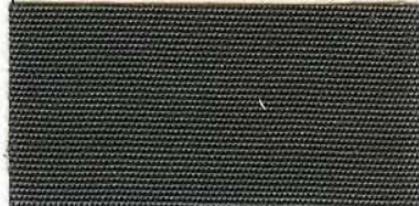
RS - 164 anthrazit