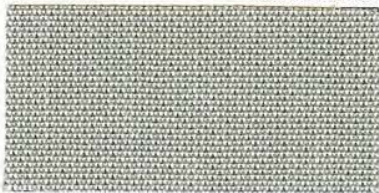
RS - 136 carbon silber