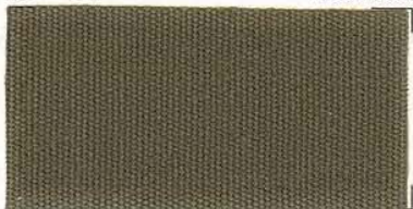
RS - 127 moonrock