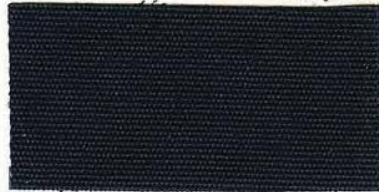
RS - 175 navy blue