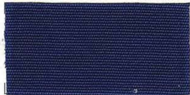
RS - 173 ocean blue