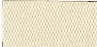
RS - 117 pearl