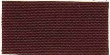
RS - 177 burgundy