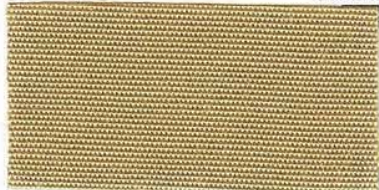
RS - 100 sahara