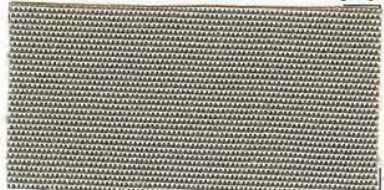
RS - 138 gray