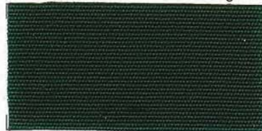
RS - 102 green